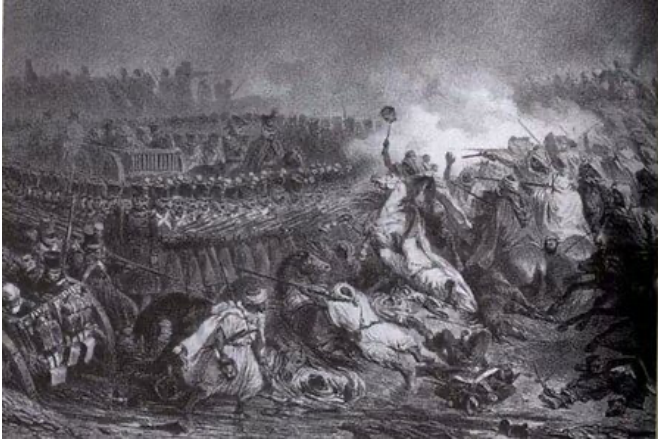
Auguste Raffet, Retraite de Constantine , lithographie, novembre 1836, BnF, département Estampes

C'est pour cela que les guerres coloniales de la première moitié du XIXe siècle furent longues et coûteuses. Même s'ils avaient une armée de cent mille hommes [1] en Algérie, les Français progressaient lentement, puisque les armes de l'infanterie des deux camps étaient comparables.