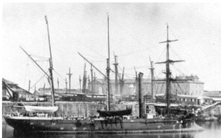
canonnière Lynx , construite à Cherbourg en 1878, armée de 2 canons de 140 mm et 2 autres de 100 mm.

Bientôt, les vapeurs ne furent plus utilisés comme remorqueurs de la flotte mais équipés d'une artillerie propre. La "canonnère" devint un symbole de l'impérialisme sur tous les grands fleuves - Nil, Niger, Congo -, permettant aux Européens de contrôler par les armes d'énormes régions jusqu'alors inaccessibles.