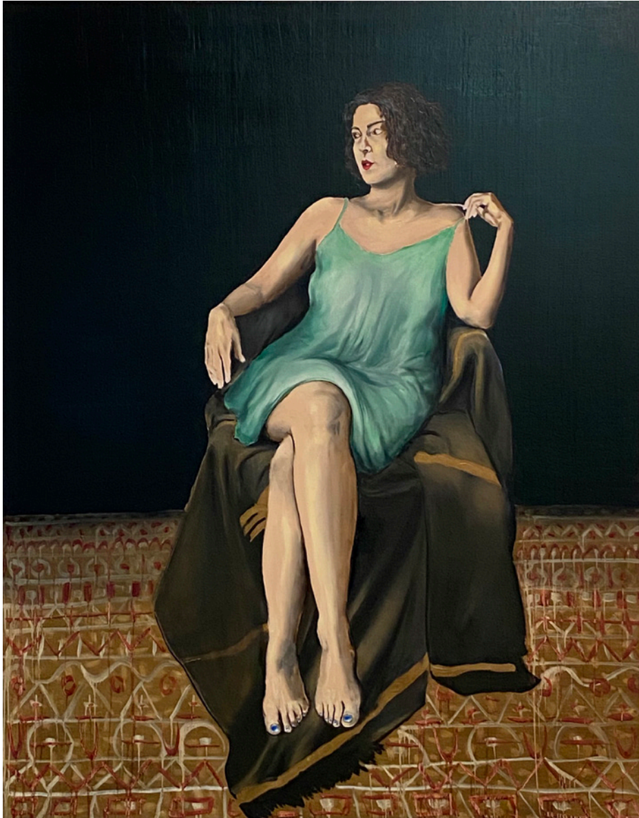
STATEIRA - 2021 huile sur bois 146 x 114 cm