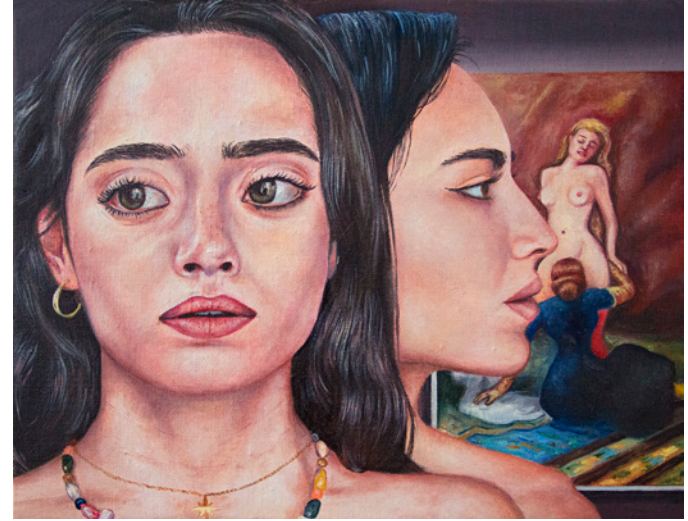
LES CRIMES DE L'AMOUR - 2020 huile sur toile 27 x 35 cm