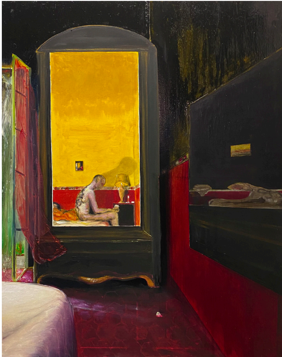
INSOMNIA - 2021 huile sur toile 100 x 82 cm