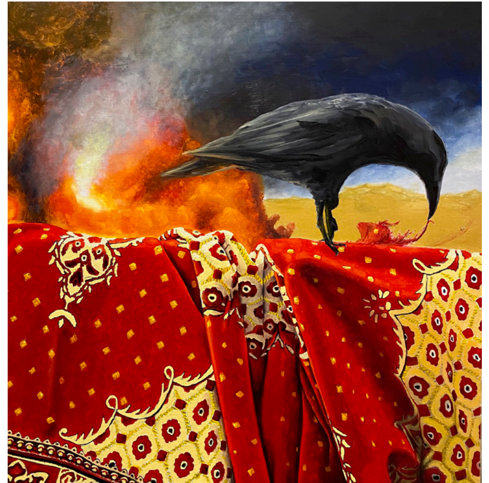
LES AMBASSADEURS - 2020 huile sur toile 100 x 100 cm