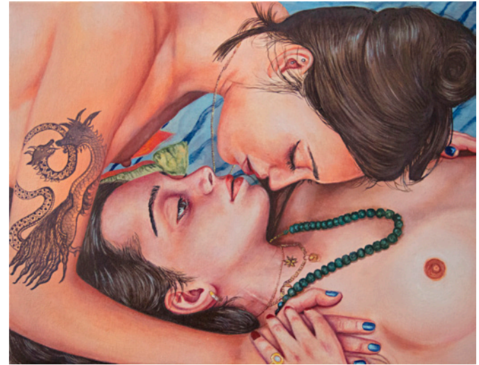
BÊTE À DEUX TÊTES - 2020 huile sur toile 27 x 35 cm