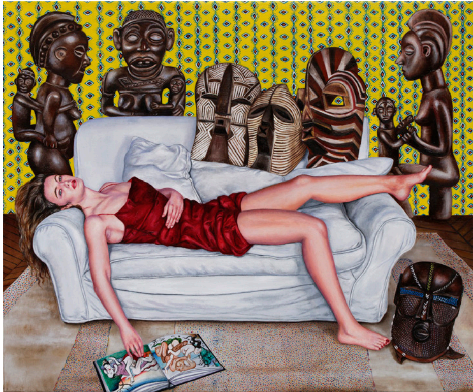
GABBEH - 2021 huile sur toile 54 x 65 cm