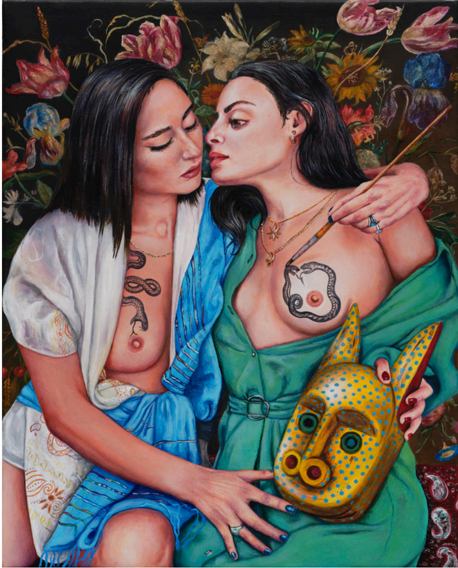
SANS TITRE - 2020 huile sur toile 50 x 40 cm