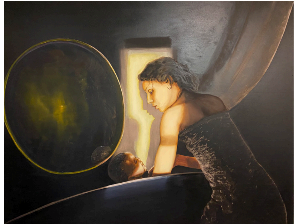
IL FAUT PARTIR - 2020 huile sur bois 114 x 146 cm

page suivante LES TRICHEURS 2 - 2021 huile sur bois 114 x 146 cm