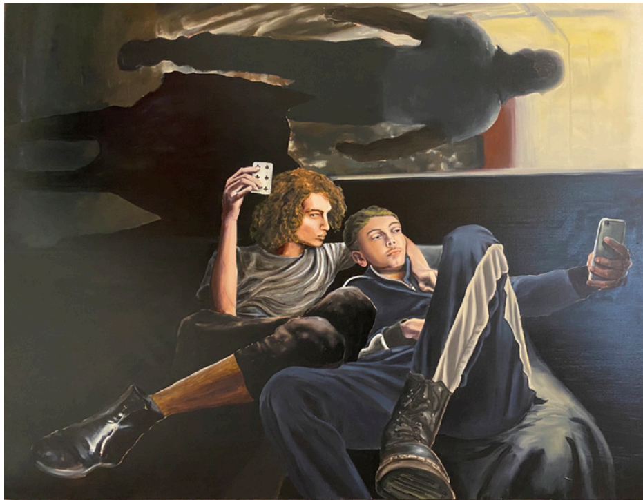
LES TRICHEURS 1 - 2020 huile sur bois 114 x 146 cm