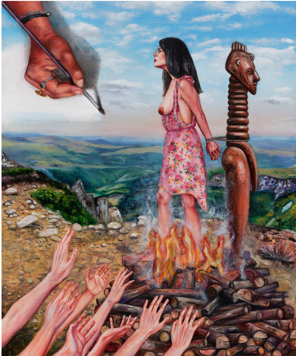
JEANNE - 2020 huile sur toile 65 x 54 cm